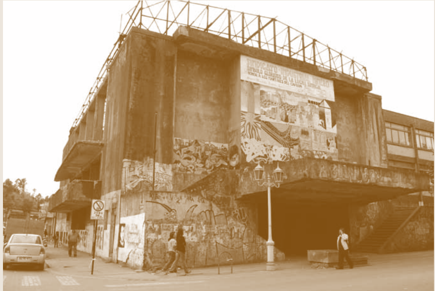
Teatro y Sindicato Obrero, nunca terminado, ubicado frente a la plaza principal de Lota.

sado, indican que no es posible reconfigurar la estructura interna del proceso productivo (condiciones tecnológicas, financieras, laborales y administrativas), porque es la obsolescencia general de las condiciones bajo las que opera la explotación la que entra en crisis y lo que le condena a desaparecer, ya que no hay posibilidad de mejoramiento continuo del proceso.