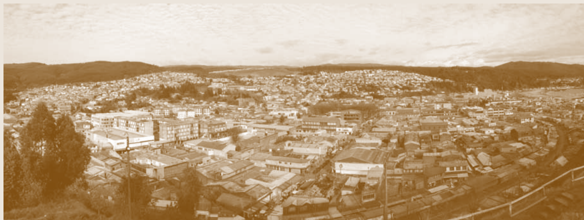
Vista panorámica actual de Lota Bajo.

mente en lo que corresponde a la situación contractual (existencial) con la naturaleza, que habla de un pacto productivo y laboral, que es el de la imagen de la mina como vientre. Esta disolución se representa también en los volúmenes deteriorados de la arquitectura de la ciudad, que hablan de la actividad industrial detenida y de los servicios asociados y complementarios que perdieron su función, quizá como metáfora de lo que acontece en la vida. De modo que, enfrentados los sujetos a lo nuevo, se produce una relocalización temporal en el imaginario tanto de las cuestiones materiales como simbólicas, ya que no hay construcción de la esperanza con los recursos y capacidades locales, ya que Lota no depende de sí misma.