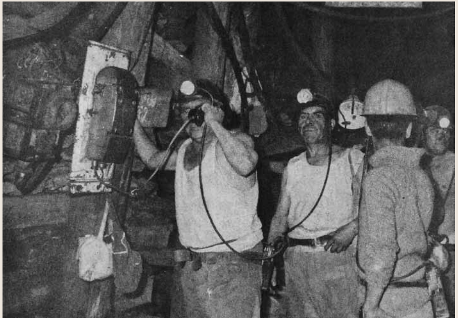
Trabajadores al interior de la mina.